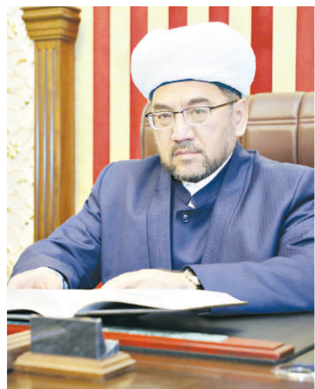
Нуриддин ХОЛИҚНАЗАРОВ, Ўзбекистон мусулмонлари идораси раиси, муфтий