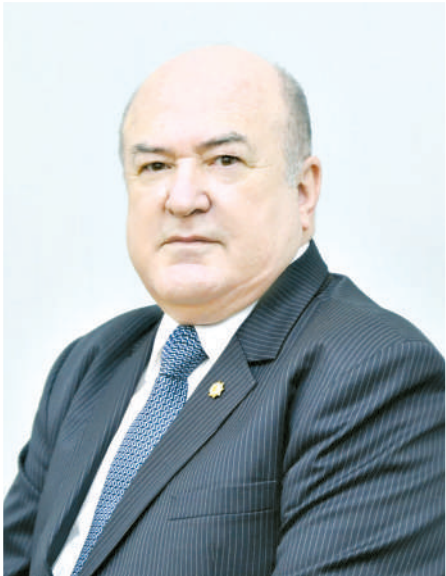
Қаландар АБДУРАҲМОНОВ, академик